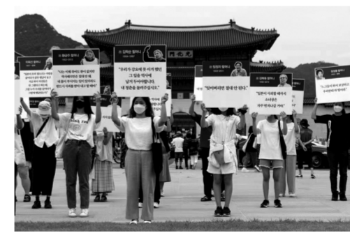
图为在韩国首尔,民众举着日军“慰安妇”受害者照片和证实在光化门广场举行抗议。 新华社发

虽然受到强烈反对,但尹锡悦依旧在“屈辱外交”的批评声中开始日本之行。据悉,日本1910年至1945年殖民统治朝鲜半岛期间强征了大批劳工到日本做苦力。韩方统计显示,被强征的朝鲜半岛劳工多达78万人。这些劳工往往被以诱骗、胁迫等方式带到日本从事劳役,饱受非人待遇,不少人甚至被折磨致死。