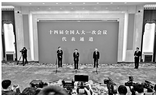
3月7日,十四届全国人大一次会议举行第二场“代表通道”采访活动,6位来自基层一线的全國人大代表走上“代表通道”,回答记者提问。