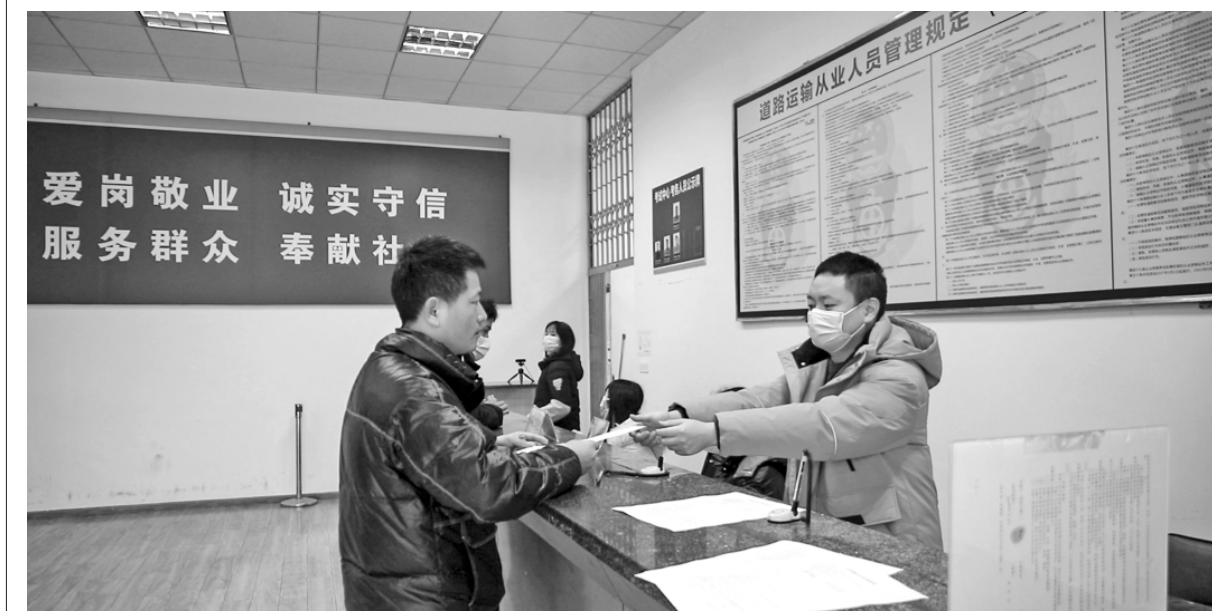
▲ 因为在四川省眉山市交通运输局政务服务窗口,一位来自外省市的驾驶员正在提交《证明事项告知承诺书》。