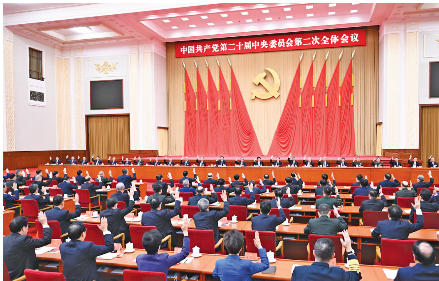
中国共产党第二十届中央委员会第二次全体会议,于2023年2月26日至28日在北京举行。中央政治局主持会议。