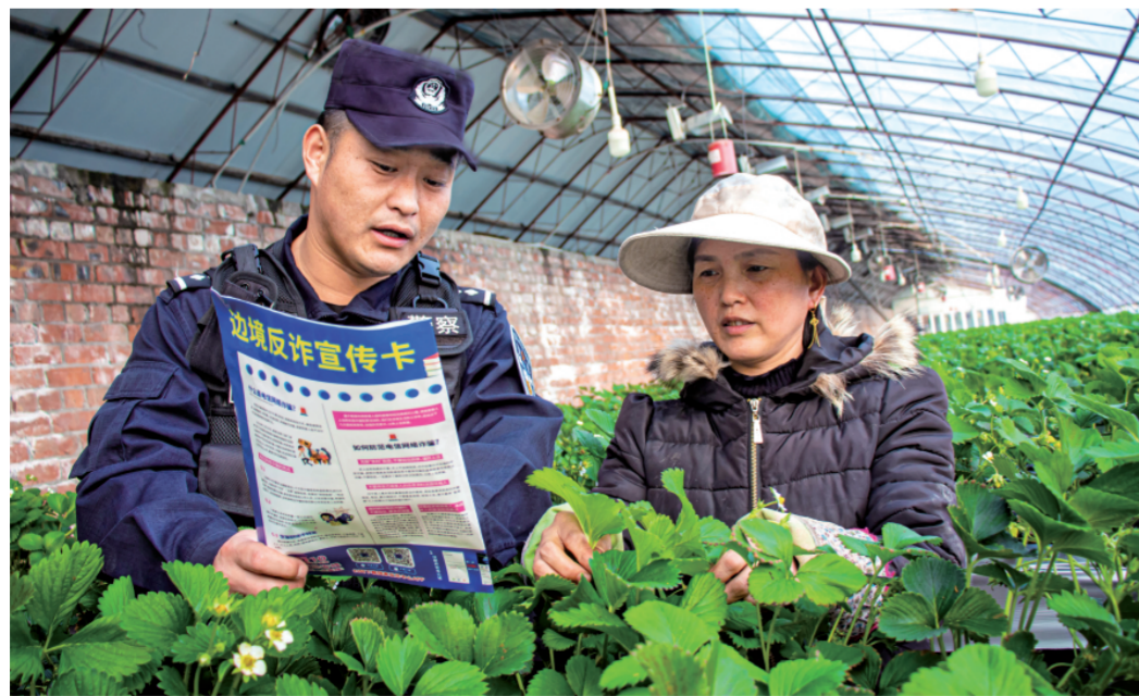
▲ 2月21日,新疆出入境边防检查总站伊犁边境管理支队回庄边境派出所成立“春季护航小分队”,走进温室大棚开展隐患排查、安防知识宣讲、反诈宣传等工作。