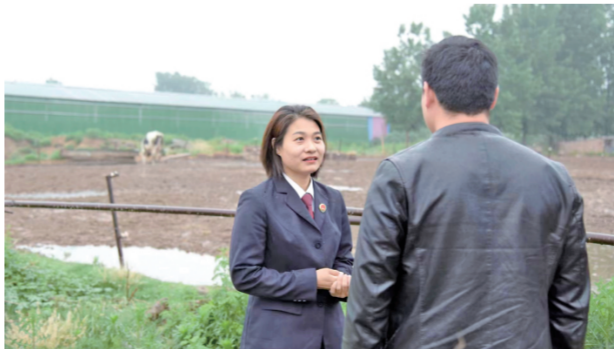
▲ 河南省中牟县人民检察院干警近日走访辖区高效农业生产企业,了解法律需求,助力消费市场回暖。