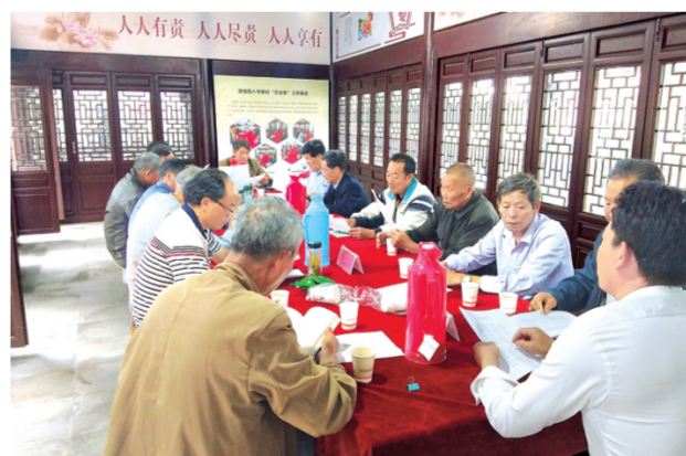
图为溧阳八字桥村“百姓议事室”的理事们就村广场改造事宜进行议事讨论。