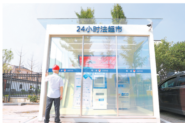
图为嘉兴市一市民准备进入二十四小时法超市咨询相关法律服务。