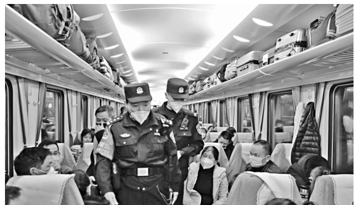
图为师徒二人巡视车厢并提醒旅客看管好贵重物品。

“60后”老乘警带着“00后”徒弟,发扬乘警“传帮带”传统精神,共同护航早春的列车,共同守护旅客平安回家路。 今年春运,福建省预计发送旅客1408万人次,同比2022年增长36.6%。为营造“平安、有序、温馨”的春运出行环境,福州铁路公安处积极开展“平安车站路金盾护你行”“携手护路 利剑除患”等专项行动,广大干部民警也坚守岗位、忠诚履职,认真开展武装巡逻、安检查危、秩序维护、隐患排查、添乘护乘、安全宣传等工作,有效提高见警率和管事率,全力护航旅客出行安全,用心绘制出一幅平安画卷。