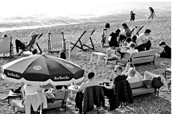
图为1月3日,人们在法国南部城市尼斯的海边休闲。