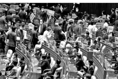
图为12月11日,韩国国会通过行政安全部长官李祥敏罢免提案。执政党国民力量党议员们抗议罢免案的表决并退场。

有日本媒体分析称,今后根据需要,日本可以依据新安保法,以行使集体自卫权为由,在未受直接攻击的情况下运用“反击能力”,比如当美军遭受攻击时,日本可以对美军提供支援,主动向对方发起攻击,这在事实上赋予日本发动先制打击的权利。日本安保问题专家指出,新安保文件已经突破了传统意义的“专守防卫”,标志着战后日本防卫政策出现重大转向。