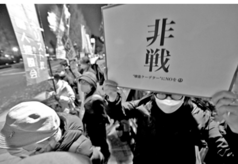
图为12月9日,日本民众聚集在首相岸田文雄的办公室前,抗议政府通过增加军费预算来加强日本防卫力的计划。

日本加强防卫力的政策既不利于东亚的和平稳定,也不符合日本自身的利益。日本国内及国外反对新安保文件的声浪不绝于耳。