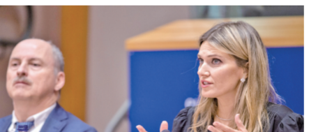
图为涉嫌腐败遭到指控的欧洲议会副议长伊娃·卡莉(右)。