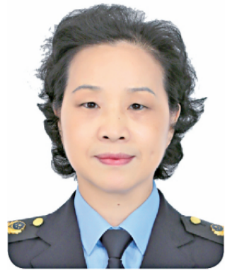
韩永生 安徽省市场监督管理局党组书记、局长