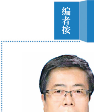
贾世辉 陕西省渭南市中级人民法院党组书记、院长

安徽省市场监管局深入推进“放管服”改革,构建企业开办“六个一”体系(即一窗受理、一网通办、一次采集、一套材料、一档管理、一日办结)。