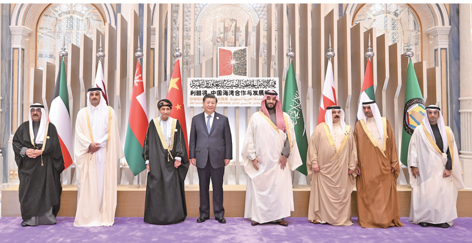
当地时间12月9日下午，首届中国-海湾阿拉伯国家合作委员会峰会在利雅得阿卜杜勒阿齐兹国王国际会议中心举行。国家主席习近平和沙特王储兼首相穆罕默德、卡塔尔埃米尔塔米姆、巴林国王哈马德、科威特王储米沙勒、阿曼副首相法赫德、阿联酋富查伊拉酋长沙尔基、海合会秘书长纳伊夫出席峰会。习近平发表题为《继往开来，携手奋进 共同开创中海关系美好未来》的主旨讲话。