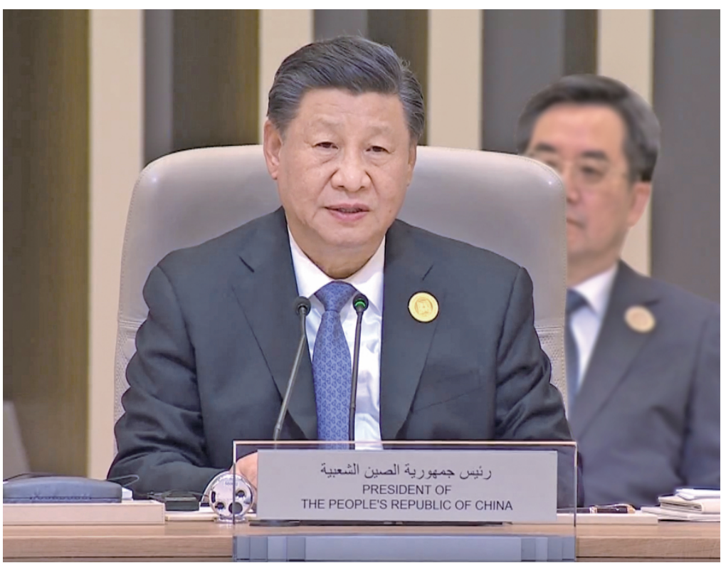
当地时间12月9日下午，首届中国-阿拉伯国家峰会在沙特首都利雅得阿卜杜勒阿齐兹国王国际会议中心举行。国家主席习近平出席峰会并发表题为《弘扬中阿友好精神 携手构建面向新时代的中阿命运共同体》的主旨讲话。

强调弘扬守望相助、平等互利、包容互鉴的中阿友好精神，携手构建面向新时代的中阿命运共同体