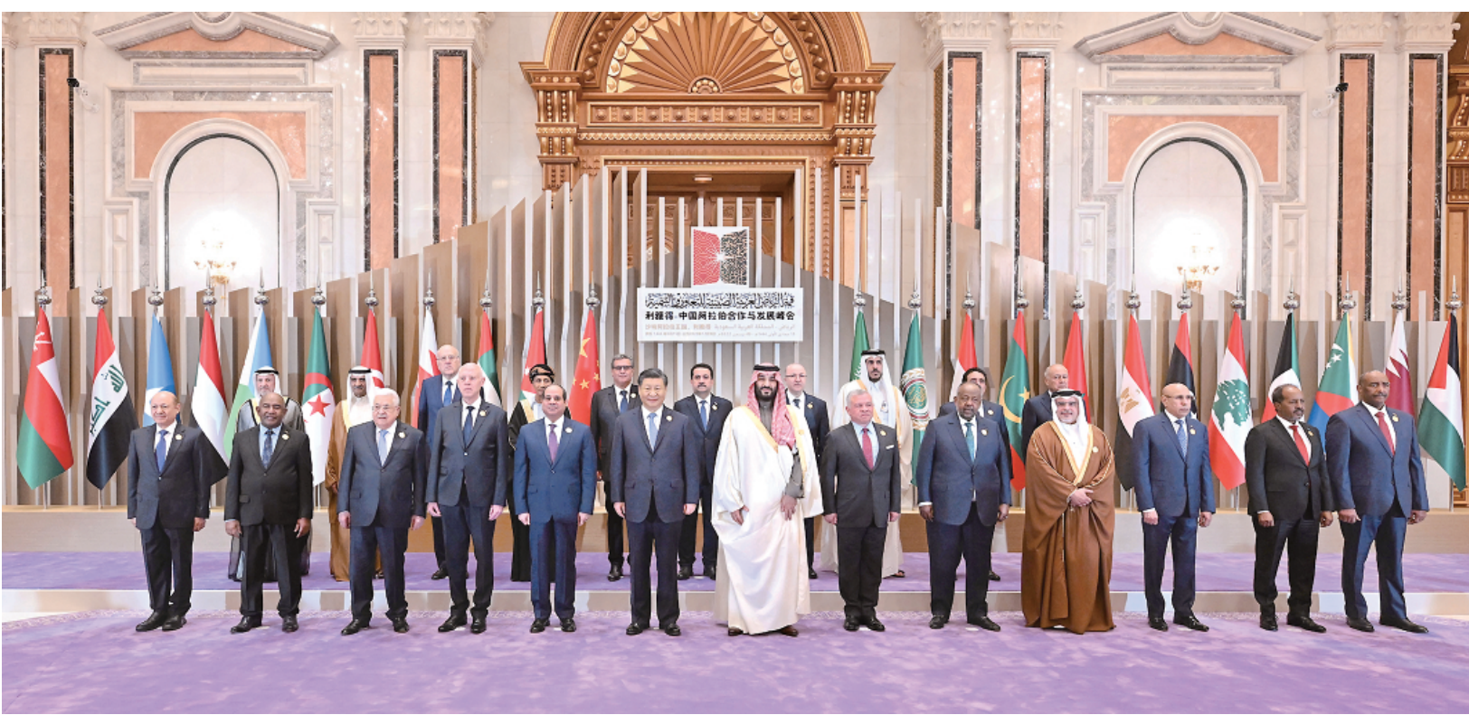
当地时间12月9日下午，首届中国-阿拉伯国家峰会在沙特首都利雅得阿卜杜勒阿齐兹国王国际会议中心举行。国家主席习近平和沙特王储兼首相穆罕默德、埃及总统塞西、约旦国王阿卜杜拉二世、巴林国王哈马德、科威特王储米沙勒、突尼斯总统赛义德、吉布提总统盖莱、巴勒斯坦总统阿巴斯、卡塔尔埃米尔塔米姆、科摩罗总统阿扎利、毛里塔尼亚总统加兹瓦尼、伊拉克总理苏达尼、摩洛哥首相阿赫努什、阿尔及利亚总理阿卜杜拉赫曼、黎巴嫩总理米卡提等21个阿盟国家领导人以及阿拉伯国家联盟秘书长盖特等国际组织负责人出席峰会。习近平在会上发表题为《弘扬中阿友好精神 携手构建面向新时代的中阿命运共同体》的主旨讲话。