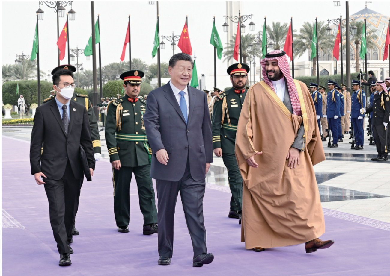
当地时间12月8日中午，沙特王储兼首相穆罕默德代表国王萨勒曼为正在沙特进行国事访问的国家主席习近平在利雅得王宫举行欢迎仪式。

新华社利雅得12月8日电 记者孙浩王海洲 当地时间12月8日中午，沙特王储兼首相穆罕默德代表国王萨勒曼为正在沙特进行国事访问的国家主席习近平在利雅得王宫举行欢迎仪式。