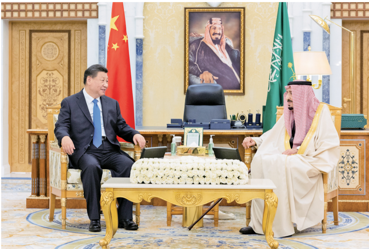
当地时间12月8日下午，国家主席习近平在利雅得王宫会见沙特国王萨勒曼。