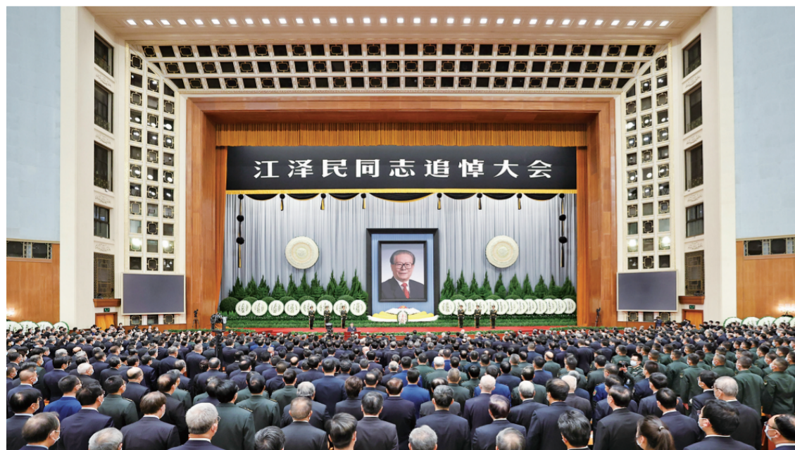
12月6日，中共中央、全国人大常委会、国务院、全国政协、中央军委在北京人民大会堂隆重举行江泽民同志追悼大会。