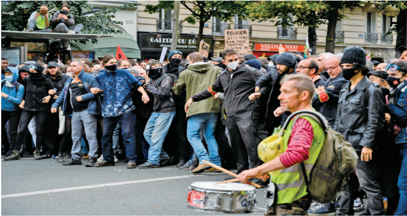
图为法国民众举行抗议活动,要求政府不再盲目追随美国脚步,并采取切实行动改善能源危机,通胀加剧对民众生活造成的影响。 人民视觉 供图

印巴厘岛举行的二十国集团(G20)领导人第十七次峰会上,当欧盟领导人就美国高价天然气问题与美国总统拜登交涉时,后者似乎根本没有意识到这个问题。其他欧盟官员和外交官一致认为,美国对欧洲售卖高价能源后果的令人担忧。