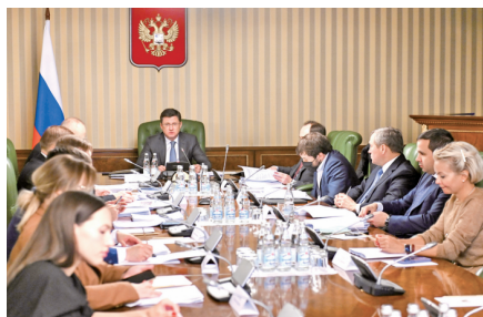
俄罗斯分管能源的副总理诺瓦克(图中)11月底再次重申,俄不会向实行石油限价的“不友好国家”供油。

不过,在欧洲国家中,一味追随美国脚步、支持对俄石油出口限价的也大有人在,有的国家甚至要求将价格限定在更低的程度。