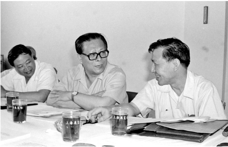
上图:1985年,江泽民同志在上海市八届人大四次会议上。