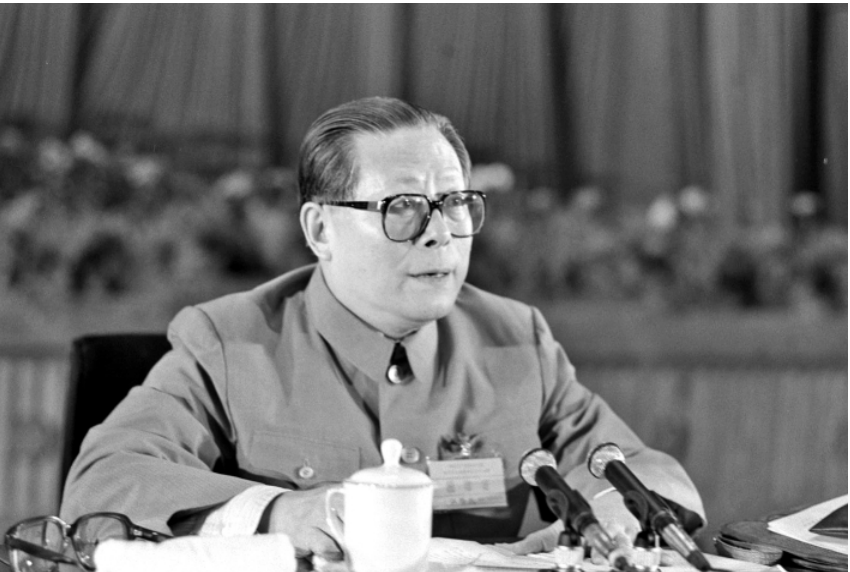
上图:1989年6月23日至24日,中国共产党第十三届中央委员会第四次全体会议在北京召开。这是江泽民同志在会上讲话。