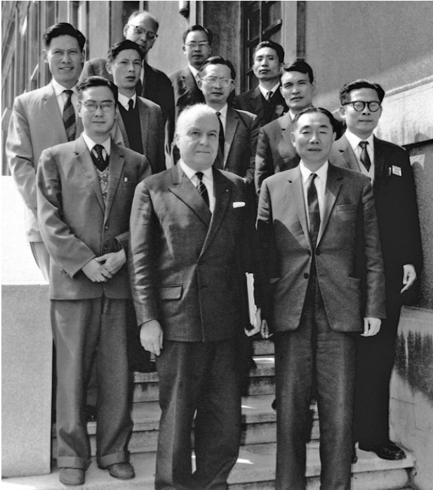
上图:1964年6月,江泽民同志(二排右一)在法国艾克斯莱班出席国际电工委员会会议期间与会代表合影。