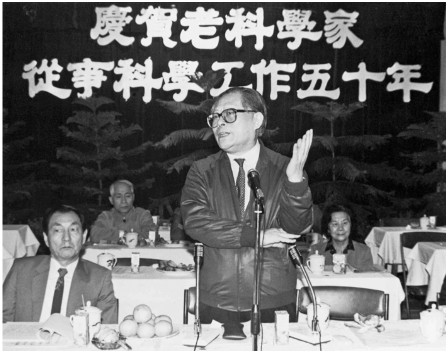
上图:1988年10月,江泽民同志在上海庆祝老科学家从事科学工作五十年座谈会上讲话。