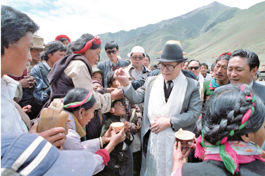
上图:1990年7月25日,江泽民同志与藏族群众共庆望果节。