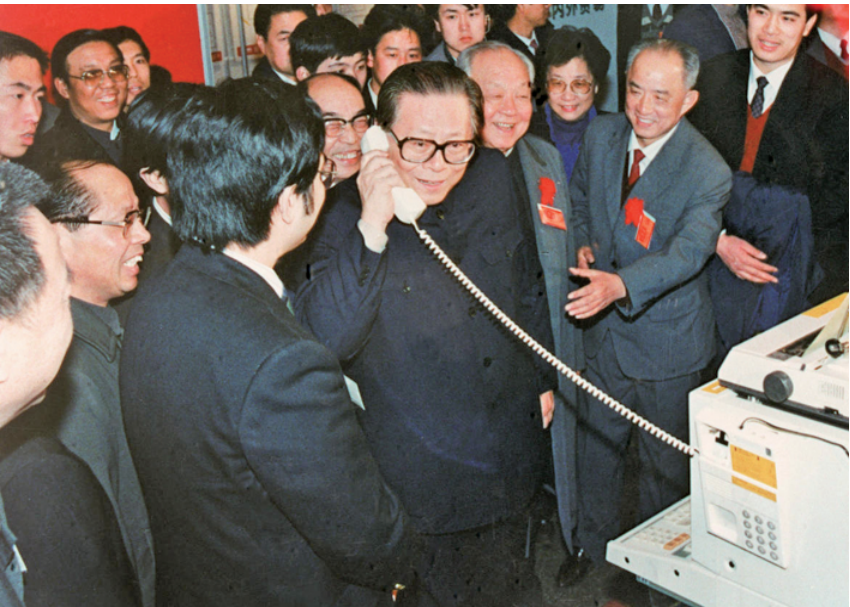
上图:1984年5月,江泽民同志在北京展览馆举行的全国电子产品展览会上,试用国际长途电话向远方的工作人员问候。