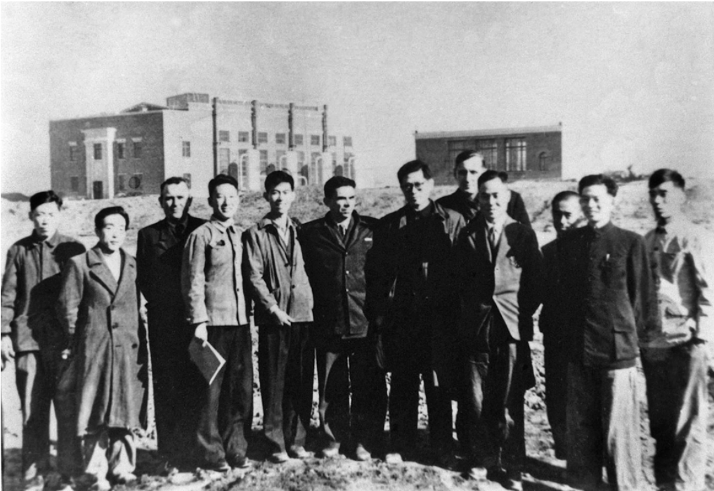
上图:1956年,江泽民同志(左七)在长春第一汽车制造厂同援建一汽的苏联专家等合影。