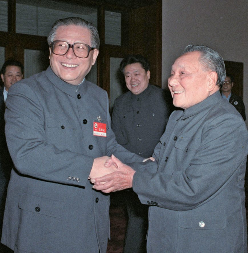
右图:1989年11月6日至9日,中国共产党第十三届中央委员会第五次全体会议在北京召开。这是邓小平同志和江泽民同志亲切握手。