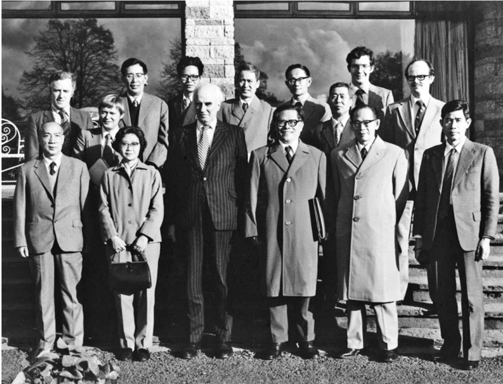
上图:1980年10月底,江泽民同志(前排右三)在爱尔兰香农开发区考察时同开发区负责人等合影。