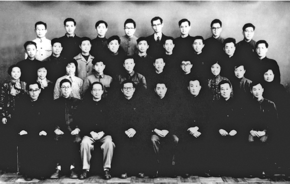
上图:1963年3月,江泽民同志(前排右五)在上海同小型三相异步电机全国统一系列设计领导小组成员合影。