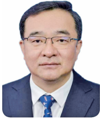
黄爱军 江苏省苏州市委副书记、政法委书记

以公共服务为依托推动社会治理现代化。基层公共服务关键看实效，老百姓需要什么，我们就做什么。要着力解决好人民群众急难愁盼问题，健全基本公共服务体系，提高公共服务水平。苏州市积极推进基本公共服务制度体系建设，启用服务企业法治需求平台，研发企业“全生命周期”法律服务产品。聚焦“放管服”改革，深化“涉案企业合规从宽”试点，探索二元化治理模式，将企业责任与企业主体责任分开评价、分别处理，为企业保存发展元气。广泛推行“一件事一次办”“两个免于提交”，成立新市民服务中心，推动长三角跨市户口迁移和户籍类证明“全程网办”，让“有一种幸福叫生活在苏州”成为集体共识和广泛认同。