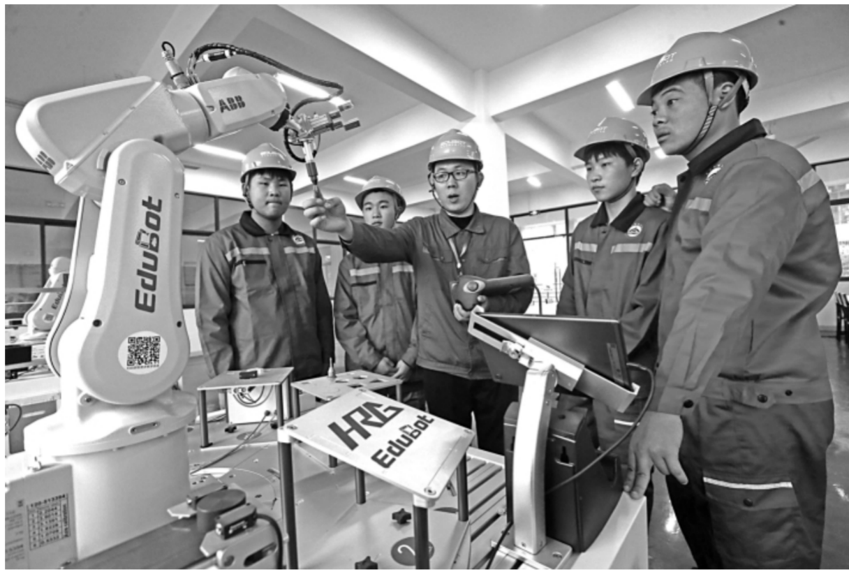
四川眉山工程职业技术学院机械加工专业的教师指导学生进行工业机器人实操训练。

“职教教师队伍建设是系统工程，也是长远大计。”任友群表示，我们将按照“创新制度、完善体系、加快补充、提质赋能”的总体思路，进一步充实数量、优化结构、规范管理、加强保障，建设一支高素质