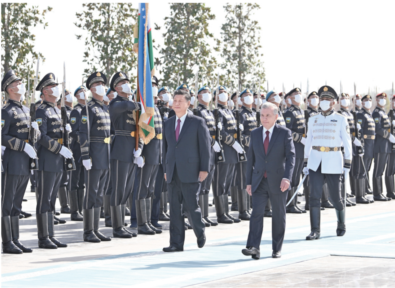
当地时间9月15日，国家主席习近平在撒马尔罕同乌兹别克斯坦总统米尔济约耶夫会谈。会谈前，米尔济约耶夫为习近平举行隆重欢迎仪式。

新华社乌兹别克斯坦撒马尔罕9月15日电 记者倪四义 范伟国 当地时间9月15日，国家主席习近平在撒马尔罕同乌兹别克斯坦总统米尔济约耶夫会谈。两国元首宣布，着眼中乌关系长远发展和两国人民未来福祉，双方将扩大互利合作，巩固友好和伙伴关系，在双边层面践行命运共同体。