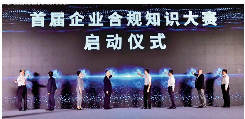
图为启动仪式现场。