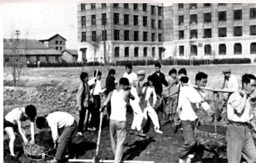
图为1959年5月，北京政法学院人工湖动工留念。

那真是这个“袖珍大学”最美好的时光。那时候，学校北门外种上了杨树，几幢宿舍楼之间栽上了核桃树和枣树，教学楼两边都是桃树，在“小滇池”和操场之间开辟出了一个桃园，教学楼和“小滇池”之间则是核桃园，联合楼的北边还有一个葡萄园，面积虽然不大，却给校园带来了勃勃