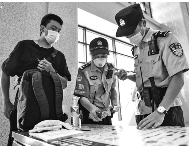
近日,重庆铁路警方大力整治铁路站、车、线治安问题,攻坚化解各类铁路安全隐患,切实维护旅客出行安全和铁路运输畅通。图为民警在奉节站对旅客携带的刀具进行处置。

本报讯 通讯员王光永 孔令军 山东省枣庄市台儿庄区人民检察院立足于人员少、规模小的客观实际,致力于素质强、业务精的努力方向,深入开展“求极致、创一流”大讨论活动,全力打造“小而精”模范院。