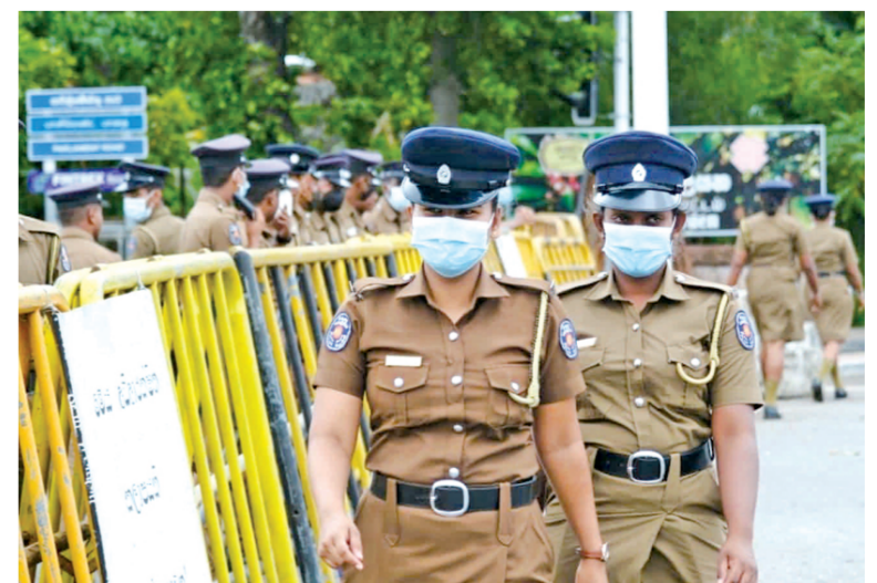
维克拉马辛哈就任总统后,动荡的斯里兰卡局势能否趋于平稳,全球都在拭目以待。图为7月20日,军警在斯里兰卡议会出入口执勤。

目前来看,斯里兰卡民众普遍希望国家尽快摆脱经济、社会和政治多重危机,生活能够回归正轨。但是,维克拉马辛哈在上任前后均面临不小的压力。据“经济一站”等斯里兰卡媒体报道,在此前的选举阶段,有抗议者曾在斯里兰卡总统秘书处门前反对任命维克拉马辛哈为总统。