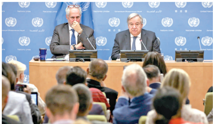
图为联合国秘书长古特雷斯(右)就气候变化问题出席记者会。