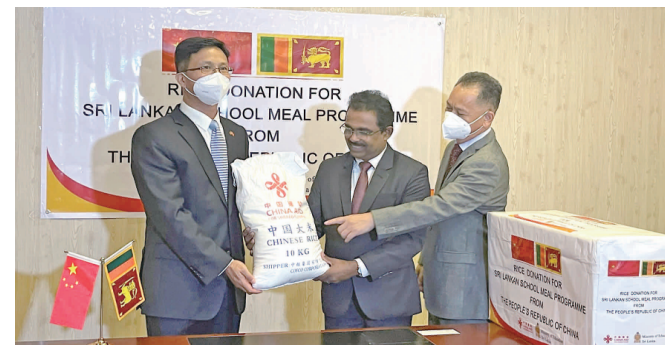
当地时间7月14日,中国紧急人道主义援助斯里兰卡的第二批粮食交接仪式在斯教育部署常设办公室举行,中国驻斯里兰卡大使威探安(左)、斯教育部署常设办公室主任哈(中)、使馆经商处参赞李光军(右)等出席仪式。

近日,拉美媒体“多极化”创始人本杰明·诺顿撰文揭露美西方自身“一身污渍”却借机嫁祸别国的嘴脸。