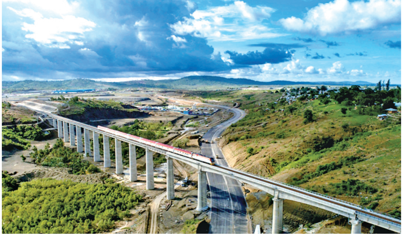
“一带一路”倡议全面实施可使3200万人摆脱中度贫困状态,有力提升更多国家的人权保障水平。图为“一带一路”标志性工程蒙内铁路,它是肯尼亚独立以来建设的首条铁路,是一条采用中国标准、中国技术、中国装备建设的现代化铁路。

与此同时,中方推动全球人权治理朝着更加公平、公正、合理、包容的方向发展,国际舆论认为这彰显出中国的智慧与担当;近年来,中国深入参与多边人权机制工作,不仅明确提出“生存权发展权是首要的基本人权”理念,而且5次当选联合国人权理事会成员,帮助其他国家提高生存权、健康权、和平权、发展权等基本人权保障水平;将“发展促进人权”引入国际人权体系;推