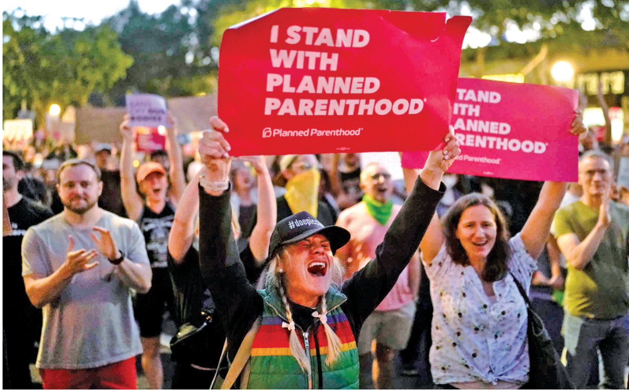
当地时间6月24日，在美国加州西好莱坞举行的一场抗议活动中，在计划生育诊所外高喊口号，反对取消对美国女性堕胎权的宪法保护。

当地时间6月27日，新墨西哥州州长签署了一项行政命令，旨在保护寻求堕胎的女性和堕胎服务提供商。新墨西哥州是美国允许晚期堕胎的六个州之一。同一天，加利福尼亚州立法机构批准了保护堕胎权的州宪法修正案，该州选民将在11月决定州宪法是否应明确保护堕胎权和生育权。这也是针对最高法院推翻