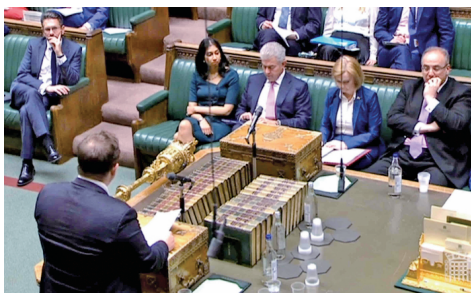
图为英国议会下院举行会议，讨论采取立法形式允许政府修改此前与欧盟签订的“北爱尔兰议定书”的部分内容。

在特拉斯6月13日向议会提交这一议案的两天之后，欧盟委员会就以英国政府不遵守“北爱尔兰议定