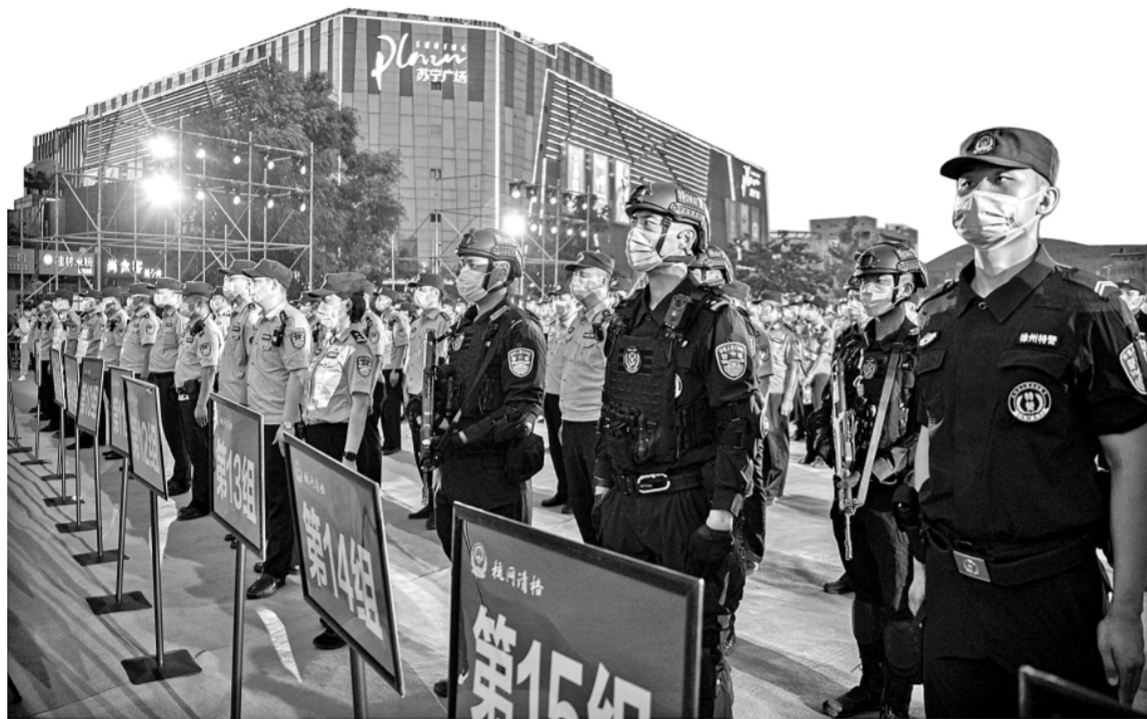
江苏徐州公安组织开展“梳网清格”大会战。图为6月16日晚相关警力在鼓楼区和信广场整装待发。

“梳网清格,就是综合运用‘梳、清、治’手段,构建立体化多层次全要素闭环防控网,确保所有风险要素都能有效