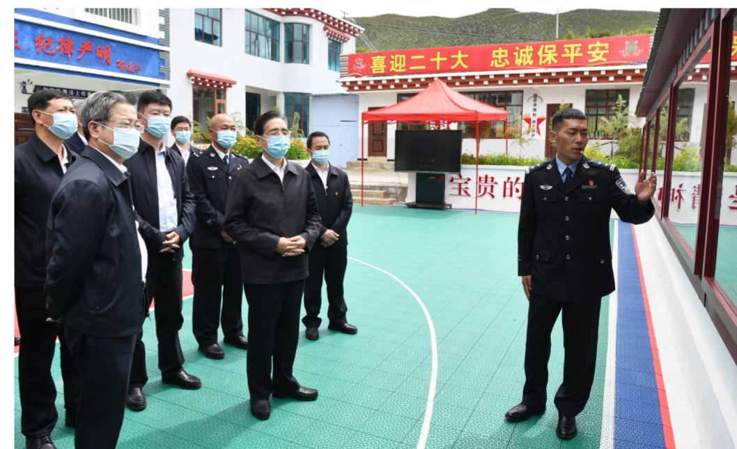
六月二十一日至二十三日，中共中央政治局委员、中央政法委书记郭声琨在云南调研。图为郭声琨来到香格里拉市公安局尼旺宗派出所调研。