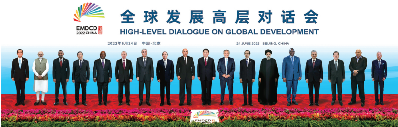
▲6月24日晚，国家主席习近平在北京以视频方式主持全球发展高层对话会并发表题为《构建高质量伙伴关系 共创全球发展新时代》的重要讲话。这是与会各国领导人的“云合影”。