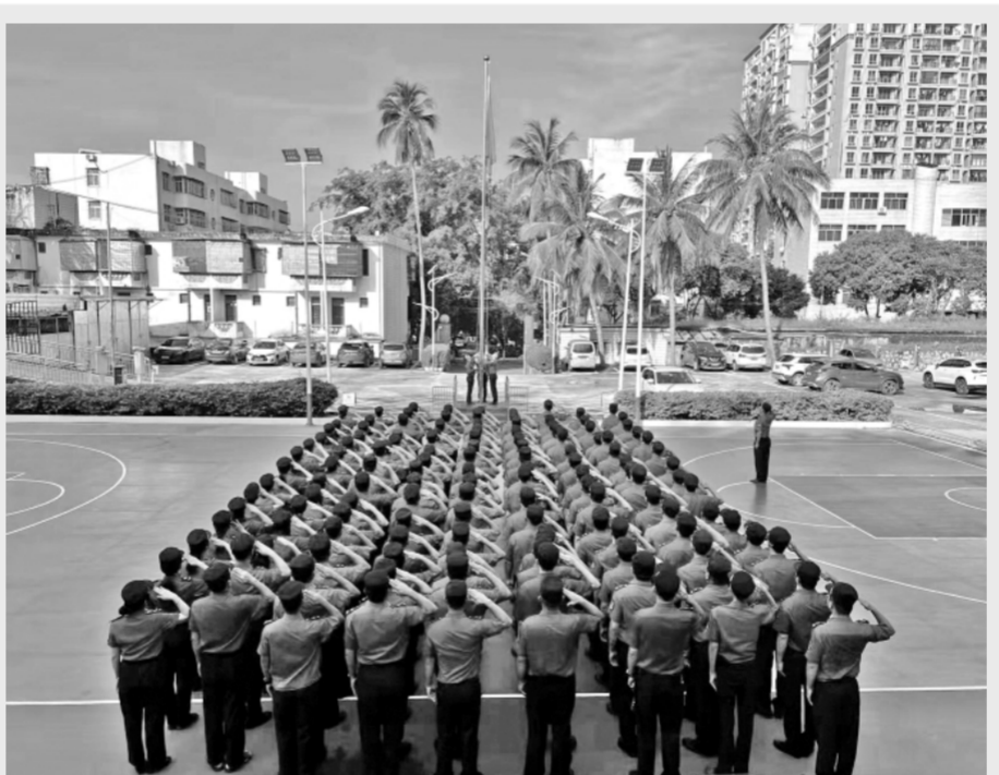
近日,海南省保亭黎族苗族自治县综合行政执法局以开展“能力提升建设年”活动为契机,举行升国旗仪式暨集体廉政提醒谈话,警示执法人员时刻牢记公正执法和廉洁纪律。图为活动现场。

比如,对违法违规股东及关联方,录入不良记录数据库,纳入不良股东名单,社会公开通报,限制或暂停关联交易,限制股东权利,责令转让股权,限制市场准入,督促或责令承担赔偿等责任;对违法违规保险机构,逐次计算罚款金额,没收违法所得,限制业务范围,停止接受新业务,吊销业务许可证。