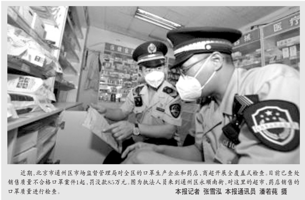
近期，北京市通州区市场监督管理局对全区的口罩生产企业和药店，商超开展全覆盖式检查。目前已查处销售质量不合格口罩案件1起，罚没款8.5万元。图为执法人员来到通州区永顺南街，对这里的超市、药店销售的口罩质量进行检查。