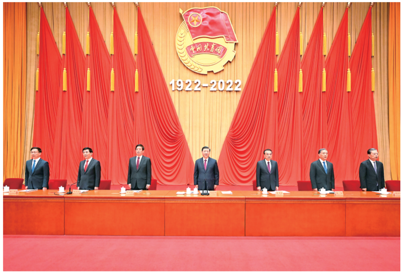
5月10日，庆祝中国共产主义青年团成立100周年大会在北京人民大会堂隆重举行。习近平、李克强、栗战书、汪洋、王沪宁、赵乐际、韩正等出席大会。

新华社北京5月10日电 庆祝中国共产主义青年团成立100周年大会10日上午在北京人民大会堂隆重举行。中共中央总书记、国家主席、中央军委主席习近平在会发表重要讲话强调，青春孕育无限希望，青年创造美好明天。新时期的中国青年，生逢其时、重任在肩，施展才干的舞台无比广阔，实现梦想的前景无比光明。实现中国梦是一场历史接力赛，当代青年要在实现民族复兴的赛道上奋勇争先。共青团要牢牢把握培养社会主义建设者和接班人的根本任务，坚持为党育人、自觉担当尽责、心系广大青年、勇于自我革命，团结带领广大团员青年成长为有理想、敢担当、能吃苦、肯奋斗的新时代好青年，用青春的能动力和创造力激荡起民族复兴的澎湃春潮，用青春的智慧和汗水打拼出一个更加美好的中国。