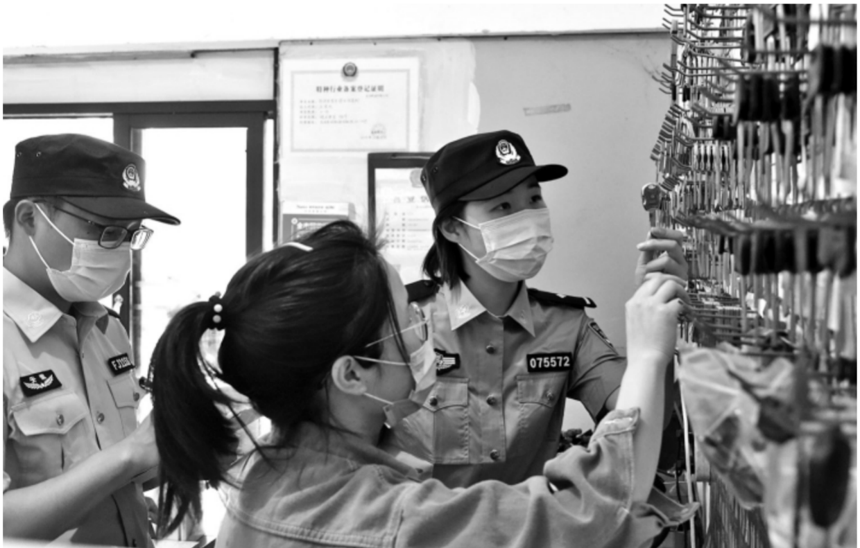
为强化对辖区内开锁行业的监管力度，安徽省当涂县公安局姑孰派出所对辖区开锁业开展安全检查。民警详细检查从业人员的日常开锁登记备案、业务开展情况，进一步规范开锁行业经营秩序及业主经营行为。图为5月5日，民警对辖区开锁业开展安全检查。