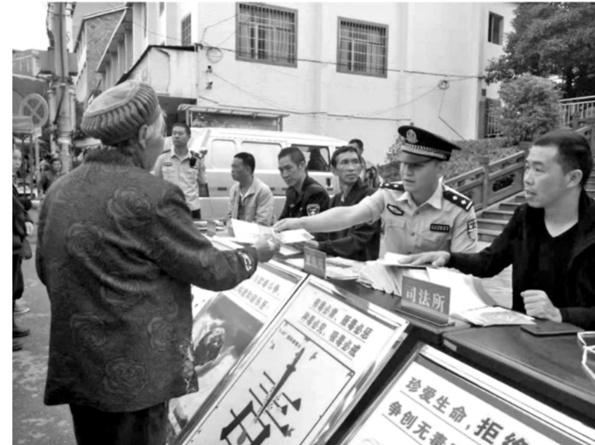
为进一步增强广大群众法治意识，提升群众法治观念，弘扬社会主义法治精神，云南省镇雄县司法局中屯司法所创新法治宣传形式，多措并举开展法治宣传。图为中屯司法所工作人员等向赶集群众发放法治宣传资料。

家家守法，法治安邦；户户守法，社会康宁。近年来，云南省镇雄县司法局中屯司法所“民主法治示范村”创建工作成效为突破口，不断加强组织建设、自治建设、德治建设和法治建设四类标准创建体系，中屯镇齐心村2021年4月荣获司法部、民政部命名的“全国民主法治示范村”荣誉称号。