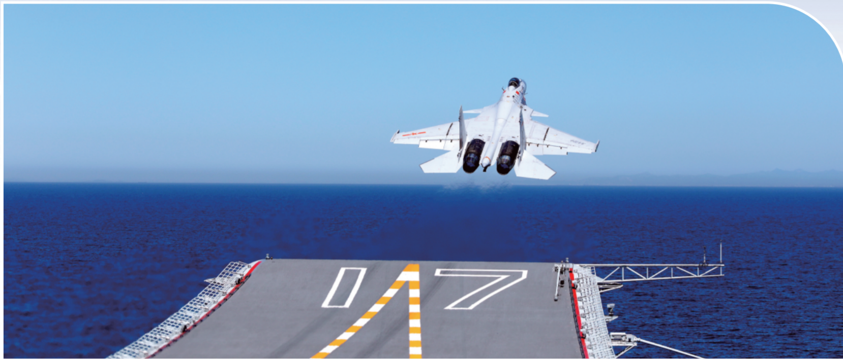
图为歼-15舰载战斗机从山东舰滑跃起飞。