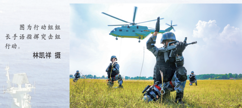
图为行动组长手语指挥突击组行动。

海军政治工作部编印下发《涉军维权实用指南》《新兵入营法律服务手册》等工具书，定期公布海军军队律师工作地域和联系方式，方便官兵获取服务、依法维权。东部战区海军开通“蓝律所”法律服务微信公众号，安排轮值律师为官兵提供“一对一”法律服务，确保军人军属法律援助诉求得到及时受理、高效解决。北部战区海军创新服务手段，与青岛市司法局开展军地协作，共建法律服务工作站，让官兵享受到地方优质法律服务资源。