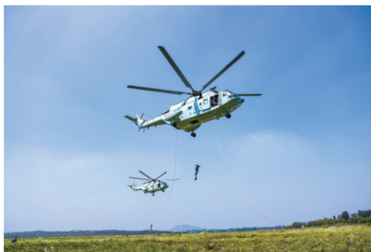
图为到达任务地域，突击组实施机吊降。

2019年4月23日，山东青岛港，庆祝人民海军成立70周年海上阅兵活动隆重举行，俄罗斯、泰国、澳大利亚等13个国家的18艘舰艇一同参加。次日，在多国海军活动高层研