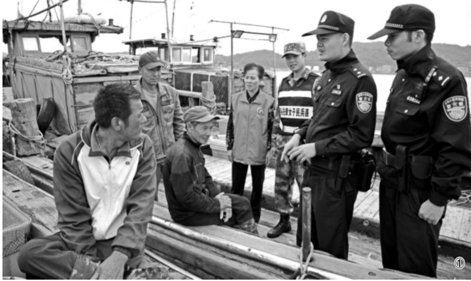
□ 本报记者 王春文/图 □ 本报通讯员 徐嘉奇 蓝莹

“请大家注意戴好口罩……”疫情出现,温州全市591家社会组织、1.71万志愿者逆向而行,投身“疫”线;“请大家守好自己的‘钱袋子’!诈骗案件时有发生,文成‘鹤城大姐’志愿服务队经常拿着小喇叭上街宣传反诈知识……在温州基层社会治理一线,群众参与的身影越来越多。