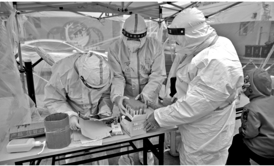
面对新一轮疫情，辽宁沈阳律师组成疫情防控法律服务团，闻令而出、下沉一线，筑成一道坚不可摧的疫情防护墙。图为律师志愿者在沈阳一处封控小区进行核酸检测前的准备工作。

据悉，宿迁律师在此次志愿活动中共向1000多名群众讲解疫情防控法律法规，解答法律咨询60余人次，为当地疫情防控工作作出了重要贡献。