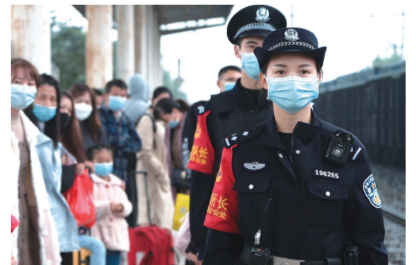
1月25日,江珊与同事在站台接车。