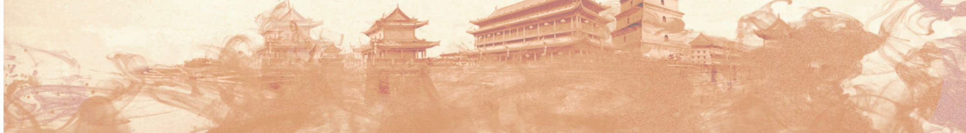
(文章节选自胡艺《案卷里的唐朝法律故事》,中国法制出版社出版)

年(624年)他被高祖特赦任命为北门供奉进马。说到北门您可能会觉得陌生,但它的另一个名字玄武门,您可能会恍然大悟。