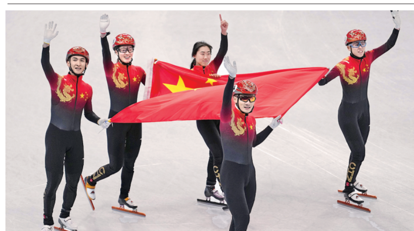
首金! 2月5日,在首都体育馆举行的北京2022年冬奥会短道速滑项目混合团体接力决赛中,中国队夺得冠军,这也是中国代表团在本届冬奥会上夺得的首金。图为中国队选手在比赛后庆祝。