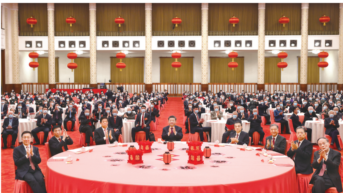
1月30日，中共中央、国务院在北京人民大会堂举行2022年春节团拜会。中共中央总书记、国家主席、中央军委主席习近平发表讲话。