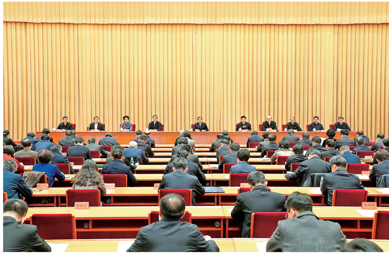
1月16日，全国政法队伍教育整顿总结会以电视电话会议形式召开。中共中央政治局委员、中央政法委书记，全国政法队伍教育整顿领导小组组长郭声琨出席会议并讲话。

郭声琨要求，要充分认清巩固深化政法队伍教育整顿成果、推进全面从严管党治警的重要性必要性，永葆自我革命精神，推动全面从严管党治警向纵深发展。要坚持把政治建设放在首位，完善做到“两个维护”的制度机制，推动党史学习教育常态化长效化，