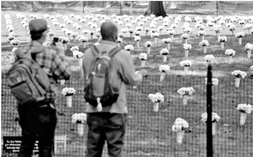
图 为美国民众在纽约炮台公园内为悼念枪支暴力遇难者摆放的白色鲜花前驻足。

美国《自然》杂志发表的研究报告显示,在新冠疫情期间,不但美国枪支销售大幅增加,首次购枪的人也大幅增加,增加幅度超过20%。也就是说,这部分人在疫情之前并没有购枪意愿,是疫情带来的治安恶化