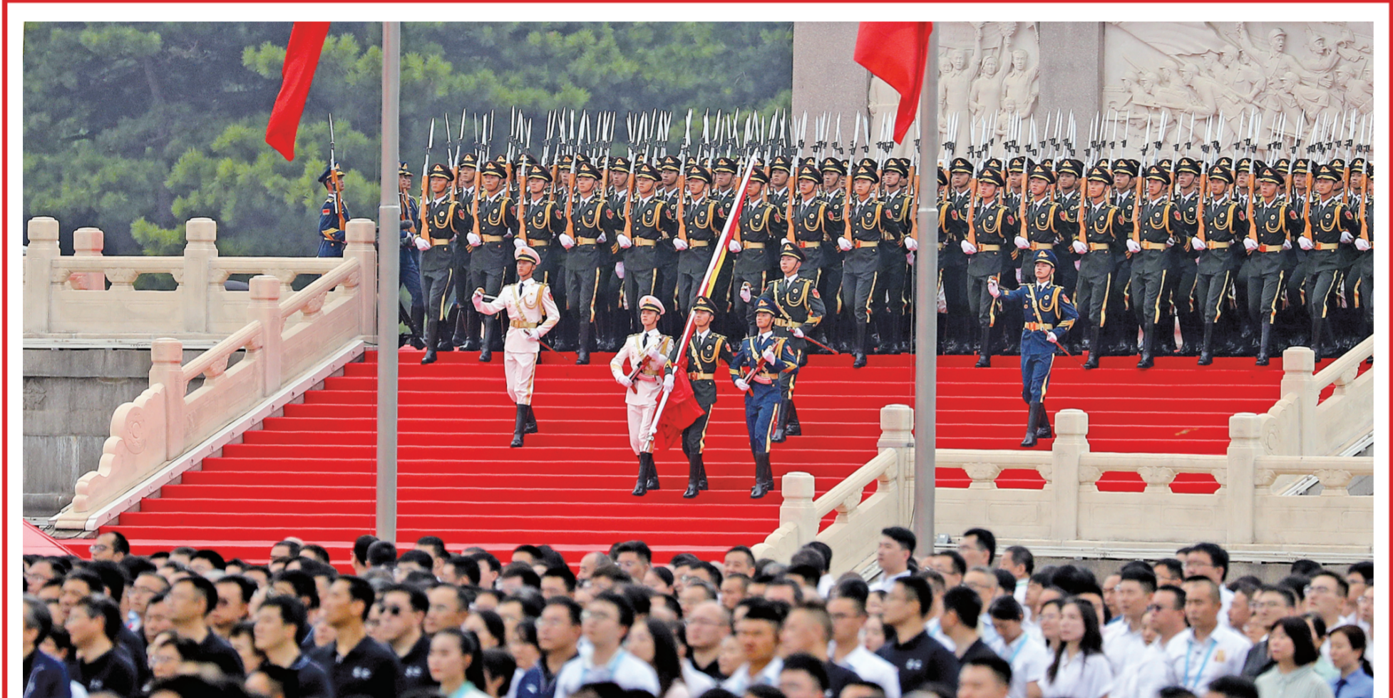
▲ 7月1日,庆祝中国共产党成立100周年大会在北京天安门广场隆重举行,各界代表7万余人以盛大仪式欢庆中国共产党百年华诞。图为国旗护卫队。