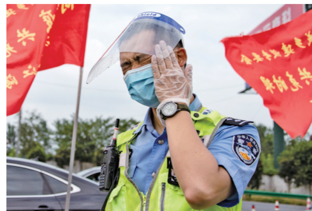
▲ 8月17日,江苏省南京市公安局交警支队民警坚守疫情防控卡点,身上的警服被汗水染成了“渐变蓝”。闷热的“秋老虎”天气下,南京市公安局交警支队全体民警坚守路面岗点,配合疫情防控工作,在热浪滚滚的车流里全力疏导交通。