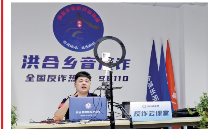
▲ 3月15日,全国公安机关召开打击防范电信网络诈骗犯罪工作推进会,部署进一步推进打击防范电信网络诈骗犯罪工作。图为5月15日,浙江省嘉兴市秀洲区分局洪合派出所辅警、反诈宣讲员进行线上直播“反诈云课堂”。