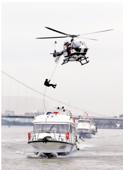
▲ 1月10日,广东省广州市公安局在珠江海口沙附近水域进行水空综合反劫持科目演练。当日,为庆祝首个中国人民警察节暨广州110报警服务平台成立35周年纪念,广州市公安局举行警营开放日活动。