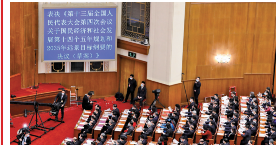
▲ 3月11日,十三届全国人大四次会议举行闭幕会,表决通过了关于国民经济和社会发展第十四个五年规划和2035年远景目标纲要的决议。