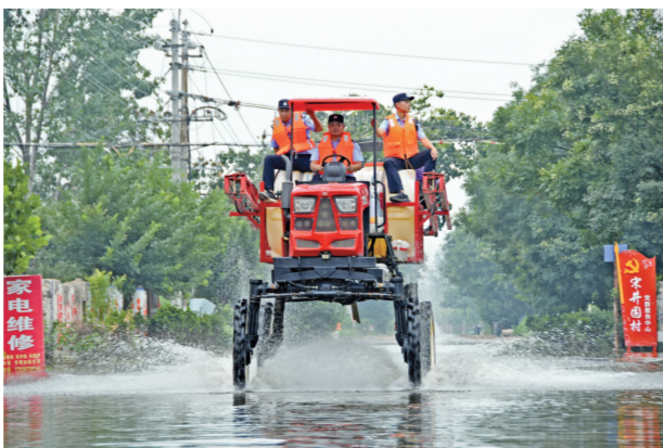
▲ 8月5日,河南省浚县公安局巡逻防控小分队民警、辅警驾驶紧急征用的一辆特种农用喷雾车巡逻查看村庄、街道灾情和治安情况。今年7月,河南省遭受了百年不遇的特大洪灾。