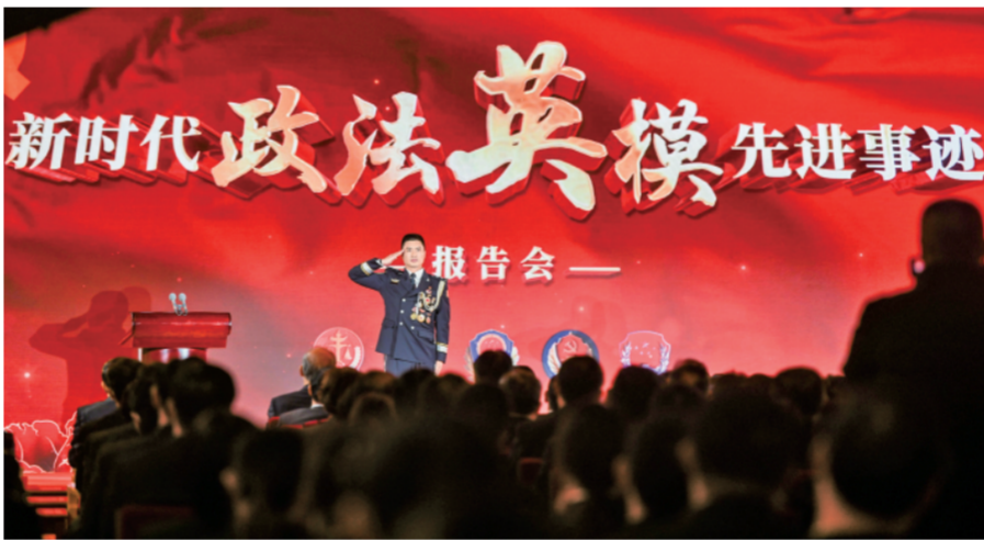
▲ 11月26日,新时代政法英模先进事迹报告会在北京人民大会堂举行,崔道植、周春梅、施净岚、潘东升、陈昕茹、张文博6位政法英模先进事迹一一展现。全国各地政法机关通过视频形式收看了报告会。