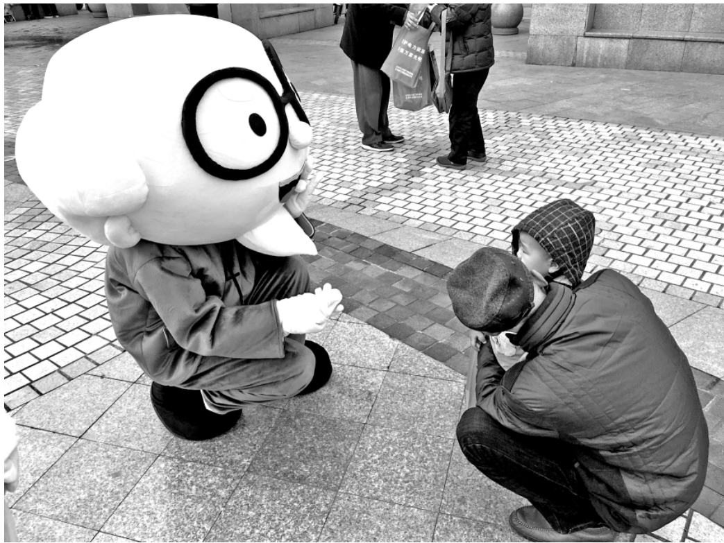
安徽宣城法治动漫人物“宣爷爷”与孩子和家长互动。