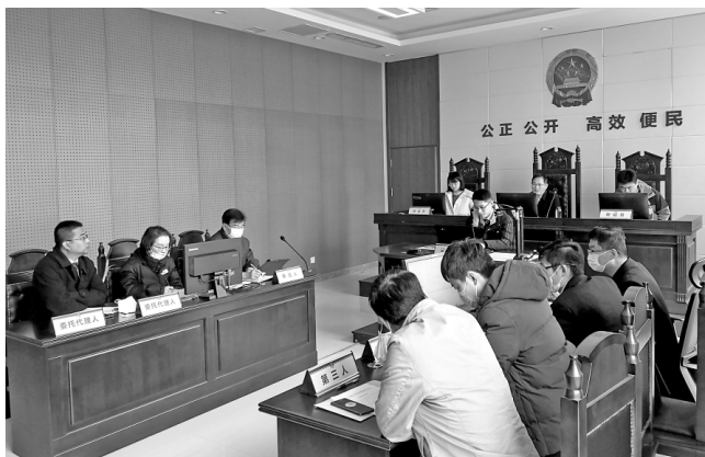
图为临沂市政府复议办公室就一起民不产不动产权证案召开听证会。

为进一步规范工作流程，临沂市建立健全《立案工作规则》《简易程序暂行规定》《调解和和解办法》等19项工作制度，在全市范围内统一行政复议法律文书格式，优先适用调解和解方式化解行政争议，按照自愿合法原则，将调解和解贯穿案件办理全过程，做到应调尽调、实质化解，对于化解行政争议仍不能解决申请人诉求的，发挥复议机构非诉讼纠纷大调解优势，延伸调解、溯源化解，切实提高行政争议实质化解效果。对争议较大的疑难复杂案件，加大听证审理力度，个别影响较大的案件通知行政机关负责人出席听证，让听证的过程变成“红脸出汗出汗”的过程，对有争议的关键证据，坚持实地调查核实研判，强化行政复议决定书的说理性，让行政争议双方看得明白、心里服气。 今年1至10月，全市行政复议案件简案快审率达28.9%，疑难复杂案件听证调查比率超过80%。 在实践中探索，临沂各地因地制宜，不断创新调解机制，加强听证制度，推动行政复议社会效果最大化。河东区司法局建立重大、复杂和涉企类案件机关负责人出席听证制度，根据听证笔录形成听证意见，结合案件证据依法作出行政复议决定，让群众感受到公平公正。莒南县司法局融合“人民调解+行政调解”，由单一化解“官民”争议转化为同时化解“民民”纠纷，今年上半年行政复议调解率达76.47%，实质化解率达96.77%。 长出监督纠错“牙齿” 2020年底，临沂市司法局在汇总分析涉嫌酒后驾驶行政复议案件管理情况后，发现交警部门在血液采