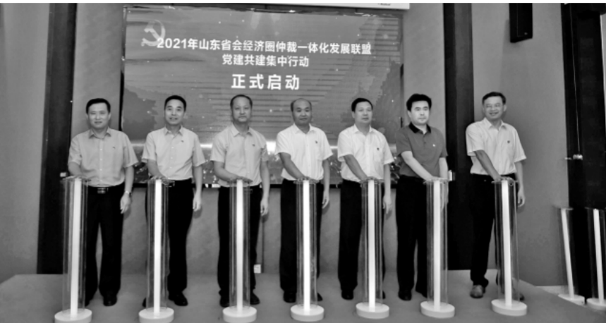
▲ 2021年6月25日,仲裁联盟举办党建共建集中行动,主会场设在聊城。图为联盟机构有关负责人在主会场共同启动党建共建集中行动。