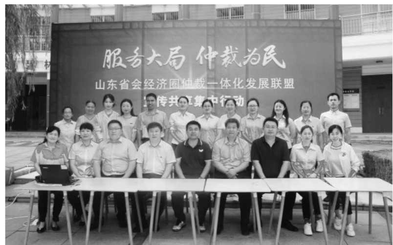
2021年9月17日,仲裁联盟“服务大局 仲裁为民”宣传共享集中行动在七地市共同举办。图为滨州分会场场景。