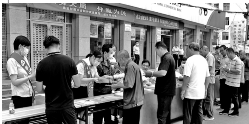
2021年9月17日,仲裁联盟“服务大局 仲裁为民”宣传共享集中行动在七地市共同举办。图为泰安分会场场景。