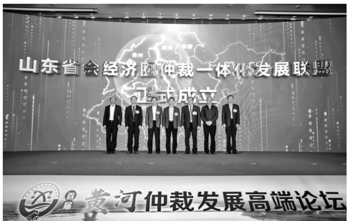
2020年11月11日,仲裁联盟在首届黄河仲裁发展高端论坛上宣布成立。