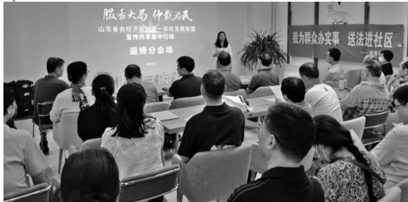
2021年9月17日,仲裁联盟“服务大局 仲裁为民”宣传共享集中行动在七地市共同举办。图为淄博分会场场景。