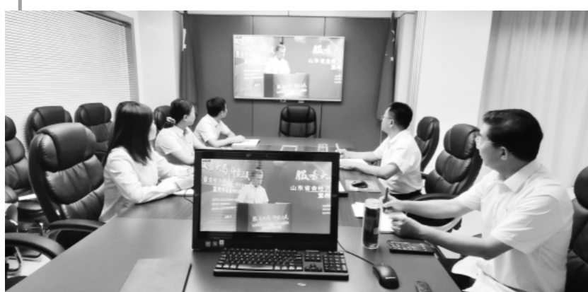
2021年9月17日,仲裁联盟“服务大局 仲裁为民”宣传共享集中行动在七地市共同举办。图为东营分会场场景。