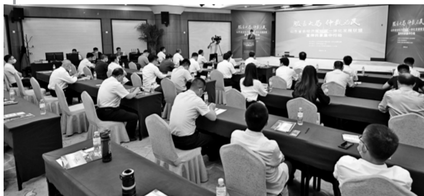
2021年9月17日,仲裁联盟“服务大局 仲裁为民”宣传共享集中行动在七地市共同举办,主会场设在济南。图为主会场场景。