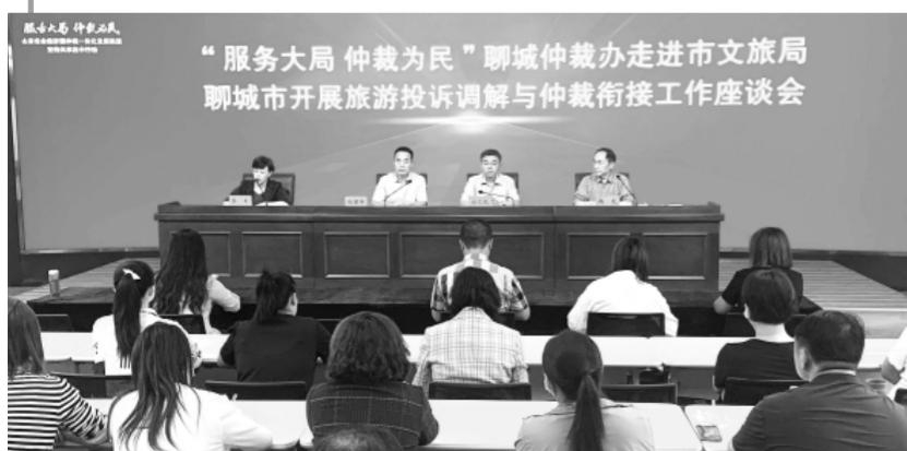
2021年9月17日,仲裁联盟“服务大局 仲裁为民”宣传共享集中行动在七地市共同举办。图为聊城分会场场景。