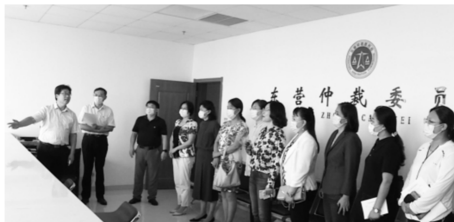
▲ 2021年9月17日,仲裁联盟“服务大局 仲裁为民”宣传共享集中行动在七地市共同举办。图为东营分会场场景。