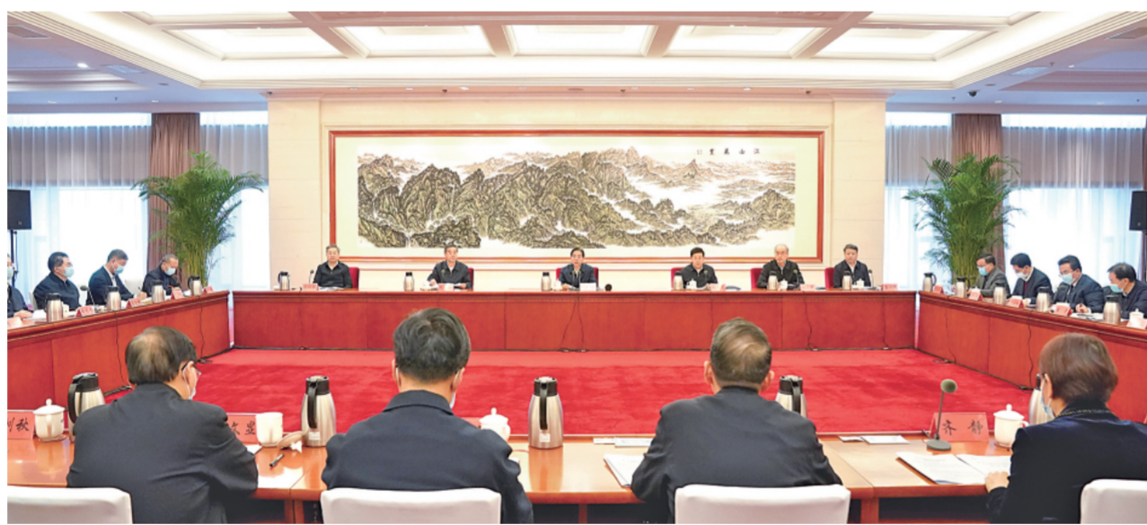
11月4日，在中央全面依法治国工作会议召开一周年之际，中央依法治国办召开深入学习贯彻习近平法治思想座谈会。中共中央政治局委员、中央政法委书记、中央依法治国办主任郭声琨出席会议并讲话。郝帆 摄

郭声琨强调，要全力推动习近平法治思想和党中央决策部署落地落实，奋力开创新时代全面依法治国新局面。要聚焦学思践悟，坚持领导干部带头学习，加强学习培训，深化研究阐释，抓好宣传解读，持续深入推进习近平法治思想的学习宣传贯彻工作。要聚焦服务大局，充分发挥法治固根本、稳预