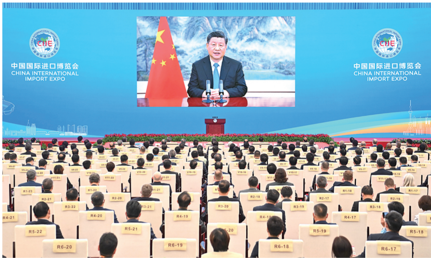
11月4日晚，国家主席习近平以视频方式出席第四届中国国际进口博览会开幕式并发表题为《让开放的春风温暖世界》的主旨演讲。

新华社北京11月4日电 11月4日晚，国家主席习近平以视频方式出席第四届中国国际进口博览会开幕式并发表题为《让开放的春风温暖世界》的主旨演讲。（演讲全文见二版） 习近平指出，很高兴同出席第四届中国国际进口博览会的各位嘉宾、新老朋友“云端”相聚。中国历来言必信、行必果。我在第三届进博会上宣布的扩大开放举措已经基本落实。中国克服新冠肺炎疫情影