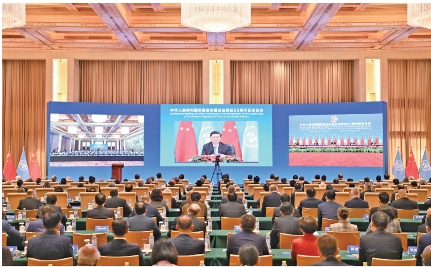
10月25日，国家主席习近平在北京出席中华人民共和国恢复联合国合法席位50周年纪念会议并发表重要讲话。