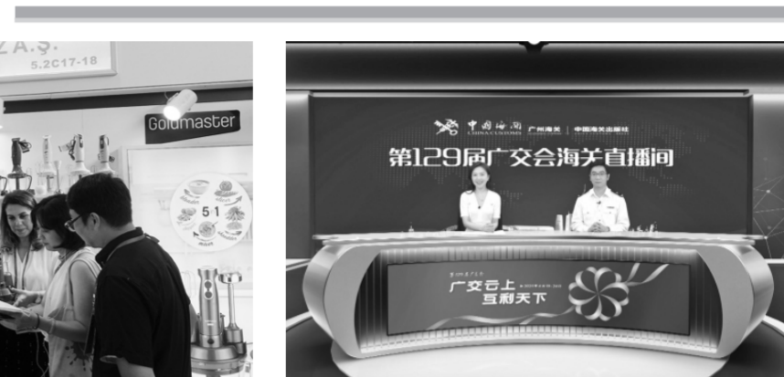
第129届广交会期间,广州海关在广交会海关直播间提供在线咨询。(资料图片)

广州海关陆续推出一系列便利服务措施。2018年,进驻广交会展馆,广州政务中心琶洲分中心办公,为广交会提供免收参展企