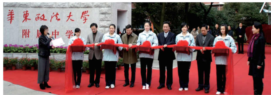
属中学开学典礼剪影