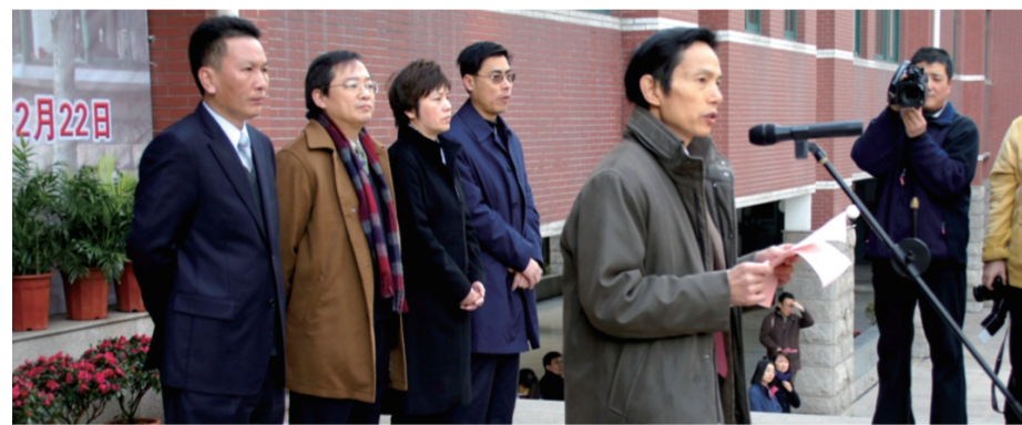
原校长(左)在华东政法大学附属中学首届开学典礼上讲话