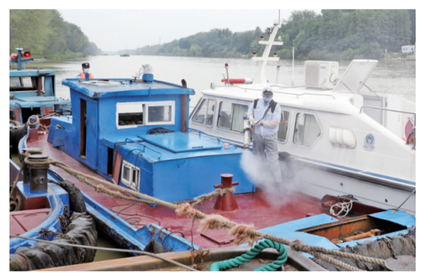
8月12日,江苏省扬州市宝应县公安局水上派出所民警对京杭大运河服务区停留的船只开展防疫消杀作业。