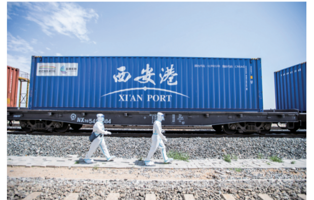
7月14日,内蒙古自治区二连浩特市迎来37℃高温天气,内蒙古出入境边防检查总站二连出入境边防检查站民警身穿防护装备开展出入境边防检查,全力筑牢国门疫情防控线,确保口岸通关安全顺畅。