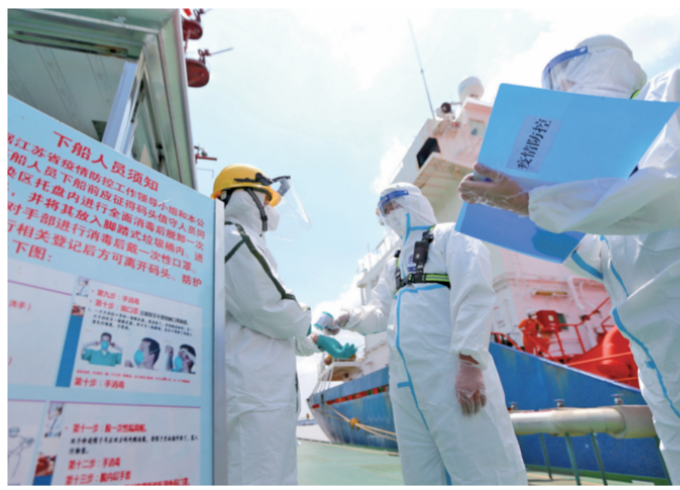
8月4日,南京港出入境边防检查站民警对南京港龙翔码头工人进行体温快速筛查。面对高温和疫情防控双重“烤”验,南京港出入境边防检查站组建疫情防控“党员突击队”,投身执勤一线。