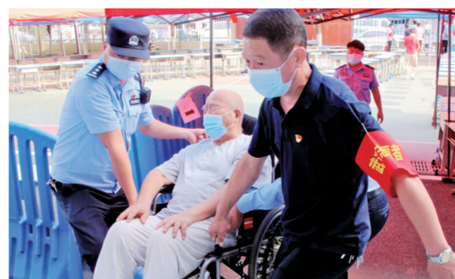
8月5日,湖北省武汉市东西湖区长青街吴家山第五小学核酸检测点,武汉市公安局东西湖区分局长青街派出所民警与志愿者帮助一名残疾人进行核酸检测。