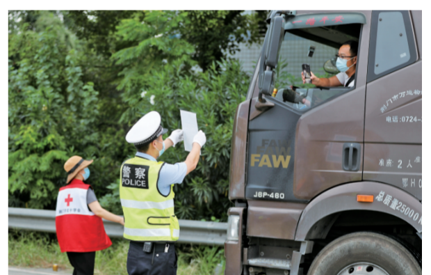
8月7日,湖北省荆门市公安局交警支队民警在二广高速荆门北出入口,对进出荆门城区的车辆实施严格管控。

8月21日,江苏省南京市公安局江宁分局民警与解除隔离人员挥手告别。21天,每天24小时值守,南京市江宁公安分局14名民警圆满完成隔离管控任务。